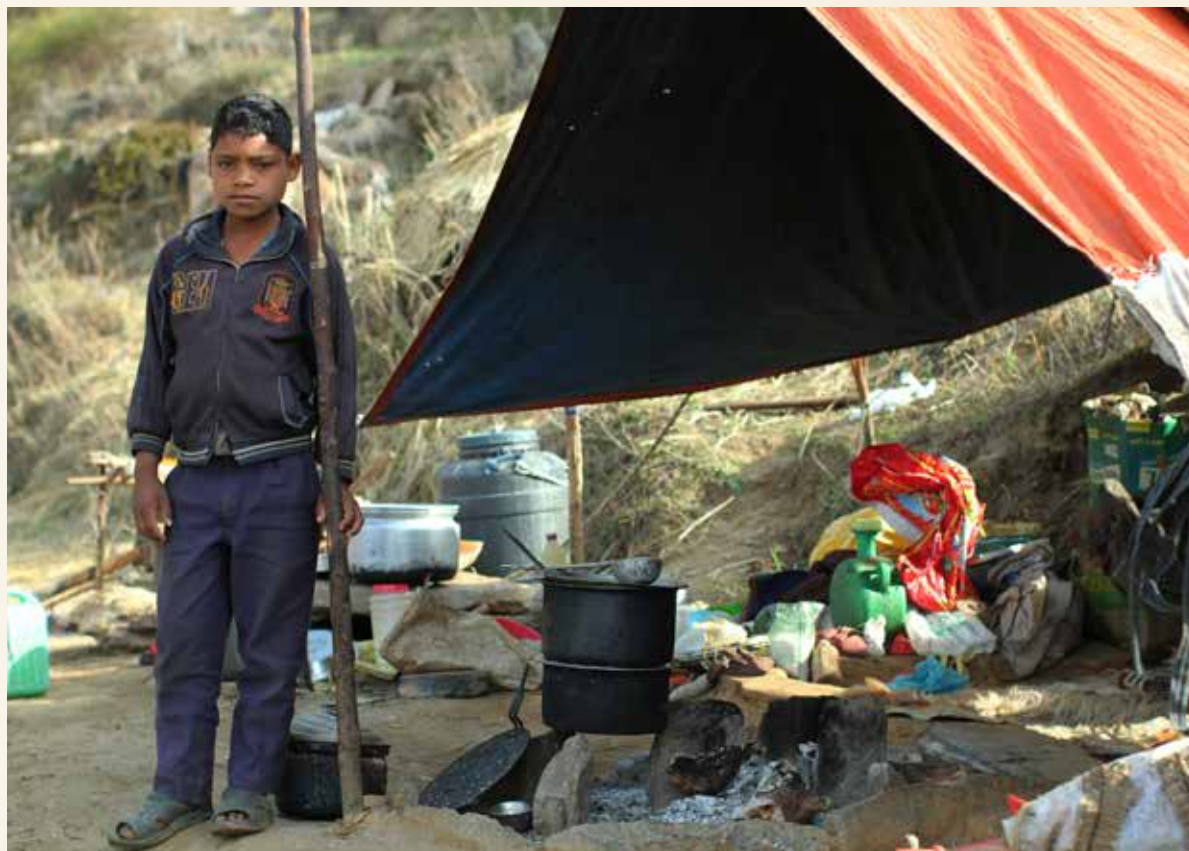
Migrantbørn kommer typisk ikke i skole fra november til april, hvor de bor i midlertidige lejre i lavlandet.