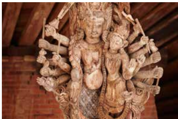
Et typisk træskærerarbejde fra tempelområdet Patan Durbar Square, hvor en stor del af de gamle bygninger blev ødelagt under jordskælvne i foråret 2015.