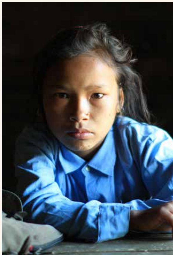
Børnene skal selv planlægge temadage om sund mad på deres skole.