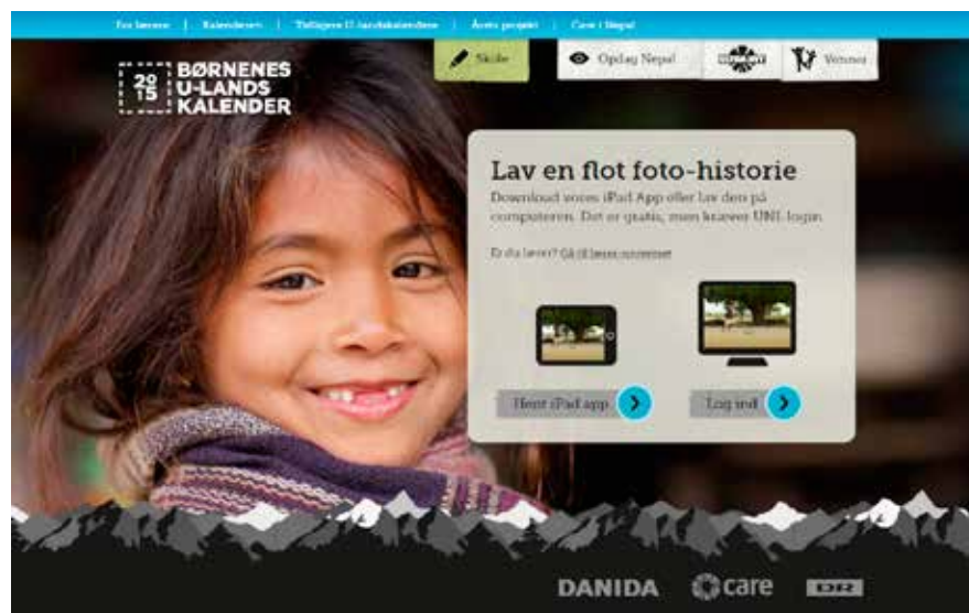
Når du har trykket på "Skole", er du indenfor i Elev-universet. Først skal du vælge, om du vil logge ind i web-versionen eller vil downloade det som iPad-app.

Alt arbejdet med fotohistorier fungerer ens uanset, om I bruger computere eller iPads. Bruger I PC, Mac eller Smartboard, foregår hele arbejdet via internet inde i elev-universet på