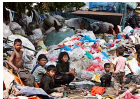
Plastaffald er en stor kilde til forurening af Kathmandus floder. Familier i slummen kan tjene lidt ved at samle og sælge plasten.