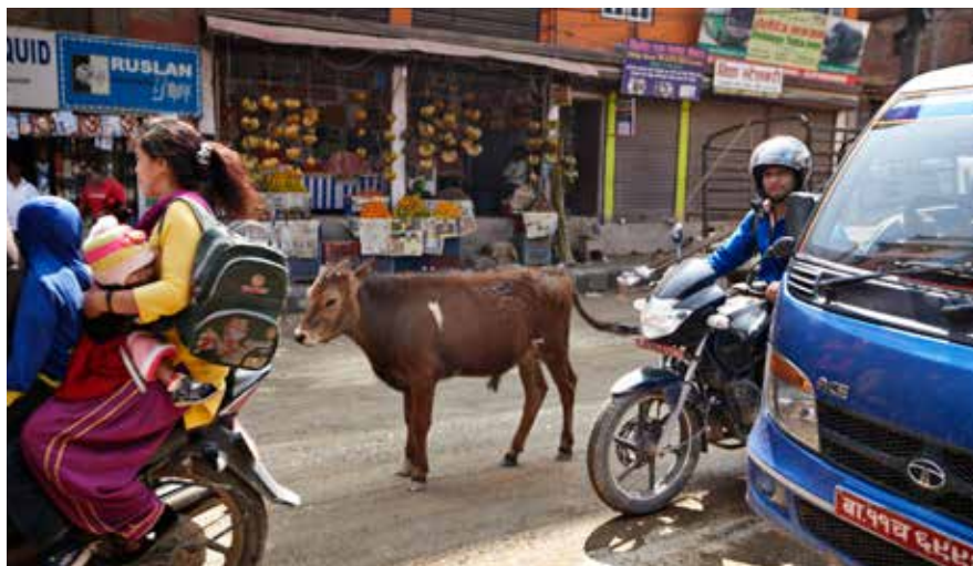
Køerne er hellige for hinduer. Derfor får de lov til at gå frit omkring overalt i Kathmandus tætte trafik.