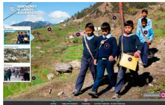
TRIN 3: Eksempel på et panorama-billede. Hotspots er markeret med et +. Bemærk pilene i siderne af billedet: De bruges til at panorere fra side til side for at finde alle hotspots. I iPad-app'en "swiper" man med fingrene.