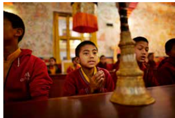
Drengemunk til morgenbøn i et af Kathmandus buddhistiske templer

Selv om newarerne kun tæller godt en million mennesker eller under 5 pct. af den samlede befolkning i Nepal, har de meget stor indflydelse, fordi magten i høj grad er centreret omkring hovedstaden Kathmandu.