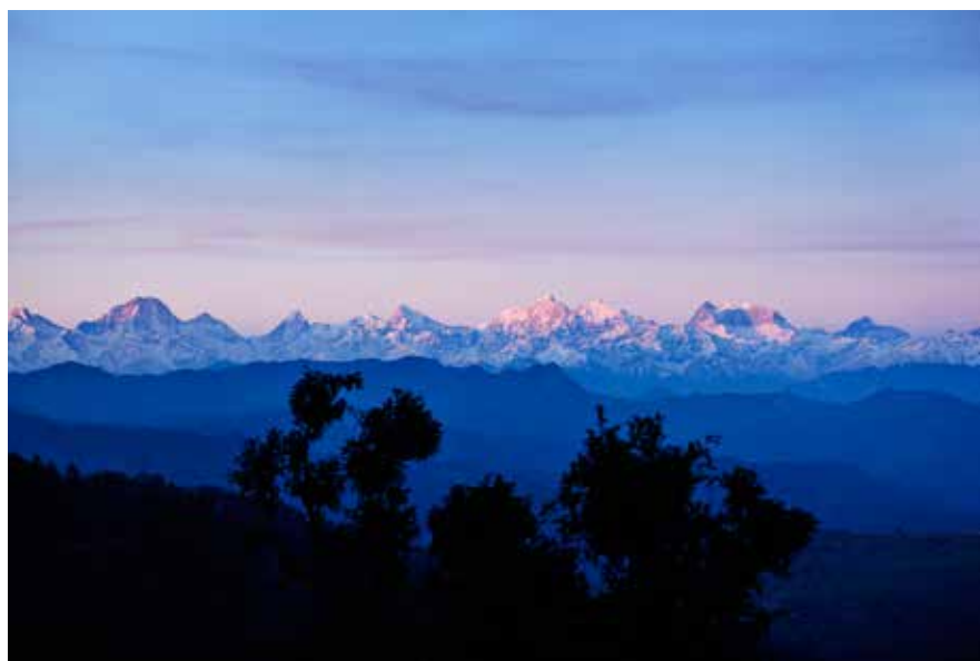
Himalaya i solnedgang. Bjergkæden rummer mange af de højeste bjerge i verden, blandt andet verdens højeste bjerg, Mount Everest. En rejse i bjergene er barsk, men også både smuk og virkelig storslået.

Langt de fleste børn starter i skole. Og ser man på alle grundskolens årgange (1.-8. klasse), går næsten 86 procent af alle børn i skole. Men mange forlader grundskolen før tid, og kun halvdelen færdiggør deres skolegang. Hvert år er der også mange børn, som må gå om. Det høje frafald og de mange omgængere er nogle af de største udfordringer, og de har rod i fattigdom, mangel på lærere og det forhold, at mange skoler stadig er dårligt fungerende.