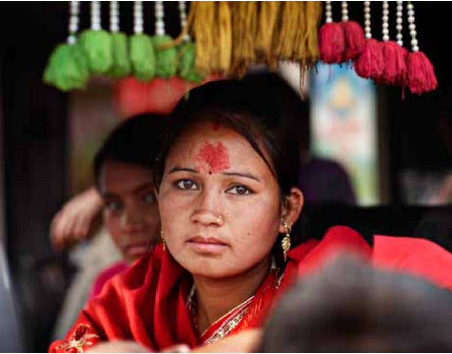
Den røde plet i panden kaldes en bindi eller en tika. Den er et tegn på guddommelig tilstedeværelse. Den viser, at personen er hindu - og den symboliserer også det tredje øje, som skuer indad.