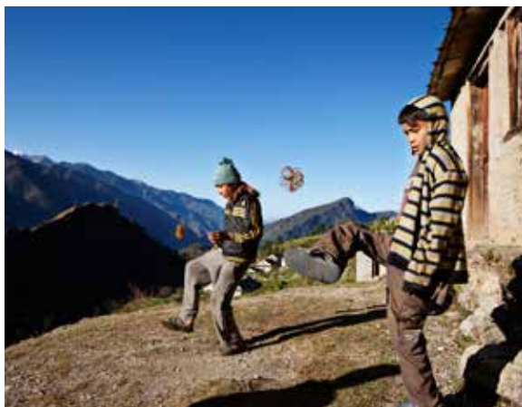
Et par drenge fra bjerglandsbyen Jugada konkurrerer om, hvem der kan holde chungu'en længst i luften. En chungu er en lille bold lavet af et bundt elastikker. Det spil er meget populært i Nepal.