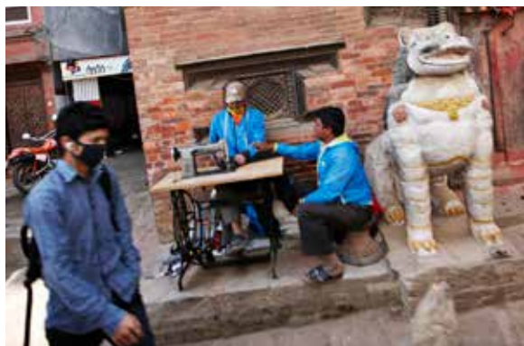
De oldgamle tempelområder er en levende del af Kathmandu, hvor man også kan få repareret sit tøj.

Nepal har siden de historiske begivenheder i 2008 befundet sig i et politisk og udviklingsmæssigt limbo. De politiske partier og regeringer har i de seneste syv år forsøgt at nå til enighed om ny grundlov. Stridighederne har især handlet om at fastlægge en ny føderal struktur med nye provinser og om at udforme et nyt regeringssystem og valg-system. Det ser dog nu omsider ud til, at de største politiske partier er nået til enighed, så Nepal kan få vedtaget en ny forfatning og begynde at få den implementeret i hele landet.