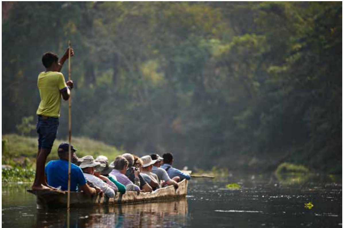
Hvert år besøger mange turister de store naturområder i det nepalesiske lavland. Her er det krokodillesafari i nationalparken Chitwan.

Der er sket store fremskridt i skolesystemet alene gennem det sidste årti, men der er også stadig meget betydelige udfordringer.