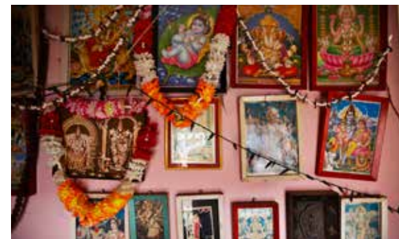
Hver morgen samles familierne om hjemmealteret for at udføre puja. I denne familie er det elefantguden Ganesh, man først og fremmest beder til.