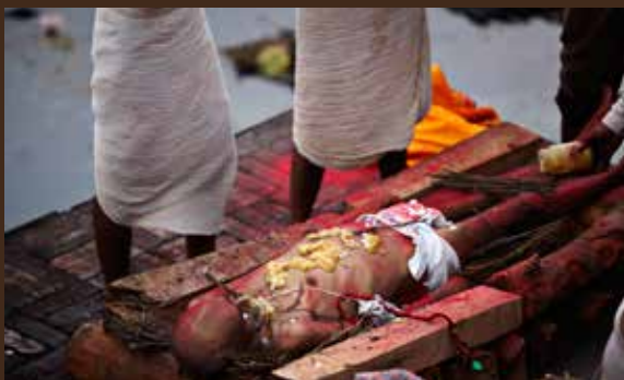
Dagen lang stiger røgen op fra talrige ligbål langs flodbredden, hvor familierne samles for at udføre den rituelle kremation af deres døde.