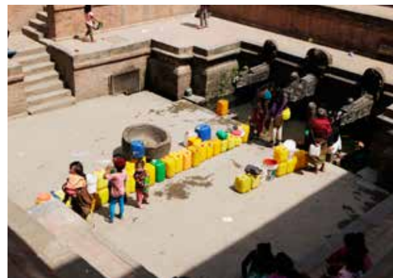
Kathmandus fattigste står i kø for at hente vand ved det gamle tempelområde, Patan Durbar Square.

Affald er et andet meget synligt tegn på overbefolkningen. Byen har et system for affaldshåndtering, hvor husholdningsaffaldet bliver hentet og kørt ud