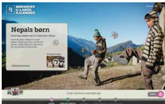
TRIN 1: På alle de tre temaforsider ligger en film af et par minutters varighed, der introducerer temaet for eleverne.

For at komme godt i gang, kan du starte med at lave en fotohistorie sammen med eleverne i klassen via den elektroniske tavle eller projektor. Så ser de, hvordan det hele virker.