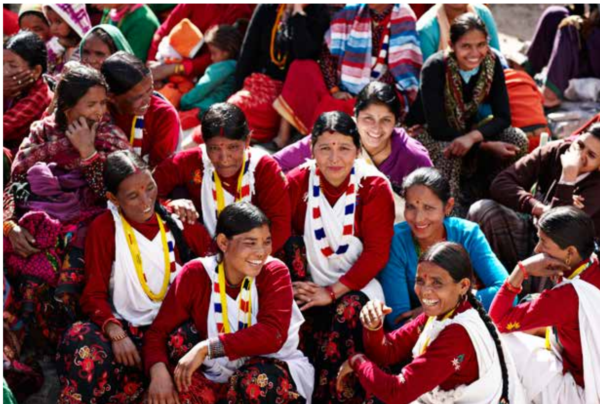
Indbyggerne i Martadi er samlet til fest for den lokale radiostation Radio Bajura. Kvinder og mænd sidder på hver sin side af festivalpladsen.

Man kan ikke med 100 procent sikkerhed fastslå antallet af de forskellige grupper i det nepalesiske samfund, blandt andet fordi der ikke er enighed om definitionerne, men der anslås nu at være omkring 60 forskellige kaster og etniske grupper og 20 større