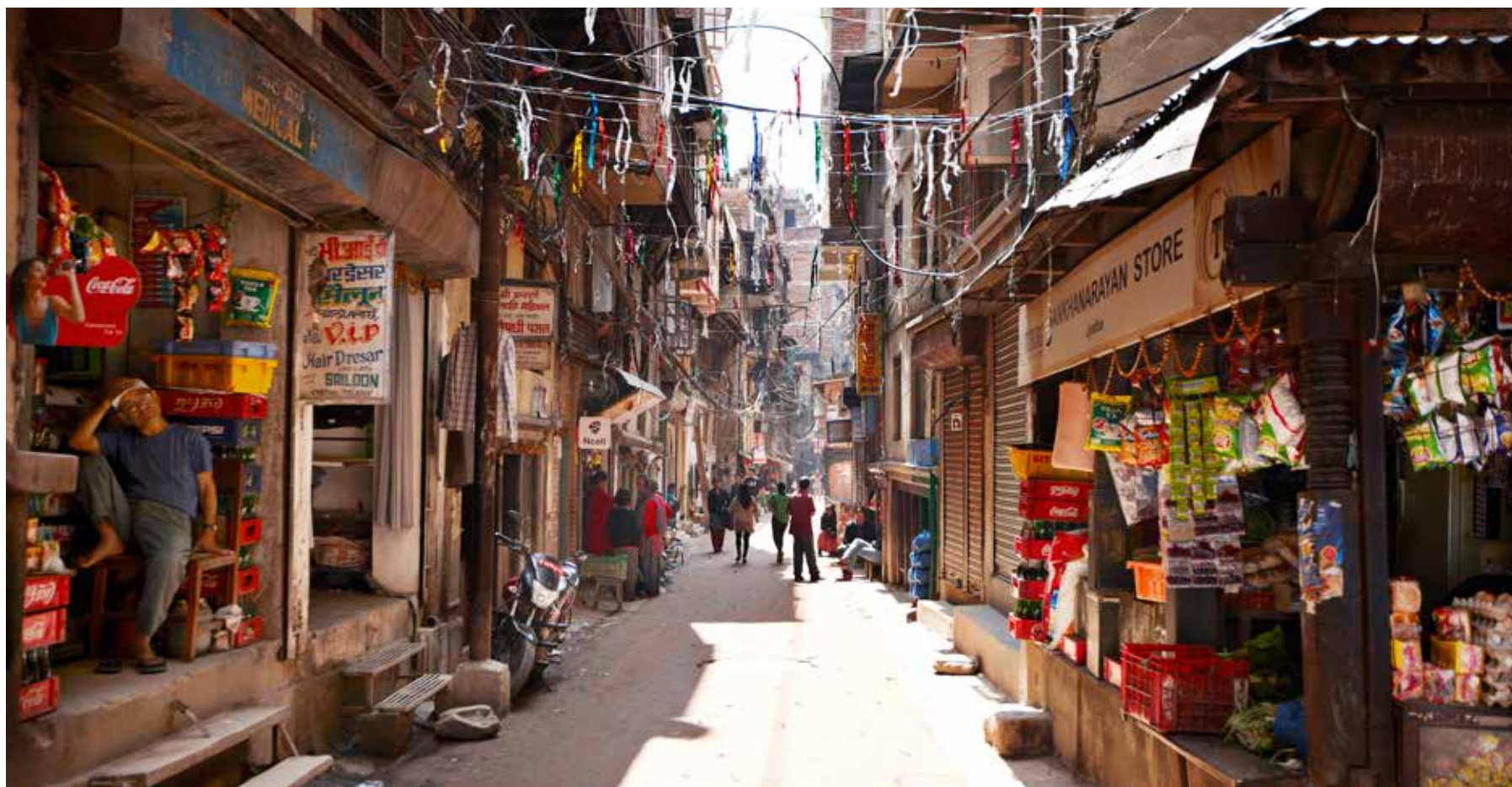
Det er nemt at fare vild i de trange smågader i Kathmandu. Men det er også en spændende og farverig by at gå på opdagelse i. Overalt er der ganske små butikker, skrædderier og gadekøkkener.

på store lossepladser, men det dækker langt fra alle dele af byen. En stor del af byens affald – og indholdet af kloakkerne – ender derfor i de to hellige floder Vishnumati og Bagmati, som løber igennem byen.