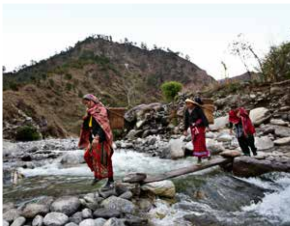
Tidligt om morgenen går kvinderne med tunge kurve på ryggen fra Jugada til hovedbyen Martadi. En vandring på tre timer hver vej - i hvertfald for en europæer i god form og uden tung bagage. Her kan de afsætte deres afgrøder på markedet.