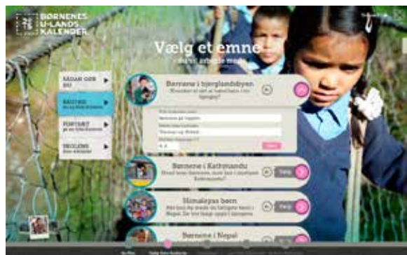
TRIN 2: Her kan eleverne oprette en ny fotohistorie ved at vælge et opgave-emne. De skal også skrive navn, klasse og titel ind.