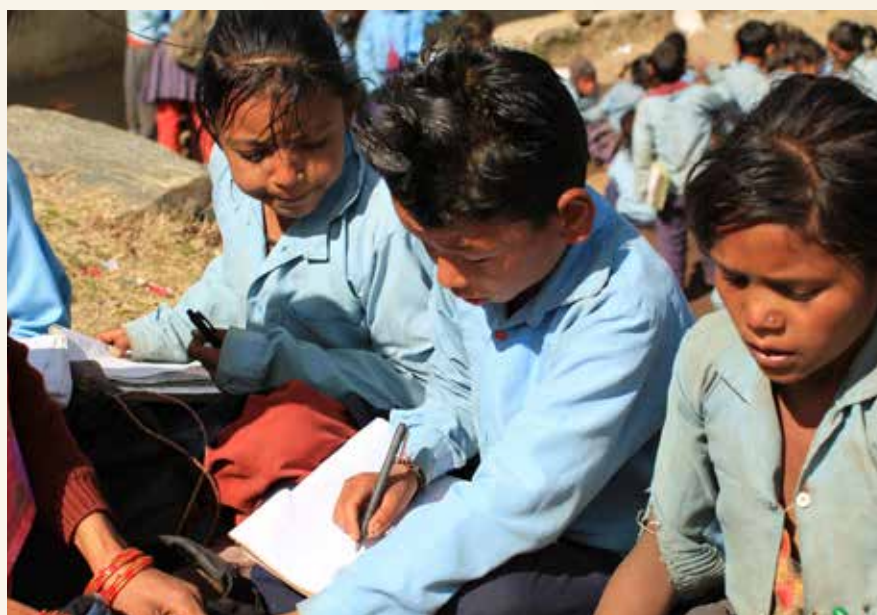
Kun 12 % af pigerne i Humla-distriktet kan læse og skrive.