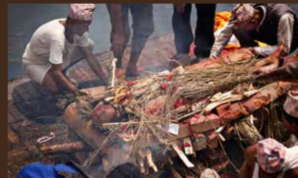
Traditionen byder, at det er familiens ældste søn, der skal sende afdøde sikkert afsted ved at tænde bålet.