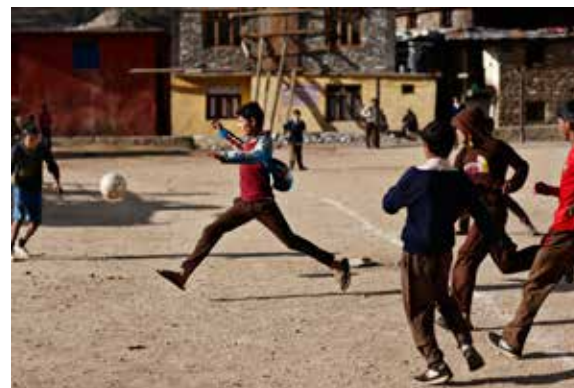
Cricket og volleyball er meget populære sportsgrene i Nepal. Men der bliver faktisk også spillet fodbold på byernes sportspladser.

Brugen og antallet af mobiltelefoner i Nepal er eksploderet inden for de senere år. I 2013 var der registreret over 18 millioner mobiltelefoner i Nepal, og antallet vokser støt måned for måned, blandt andet fordi billige telefoner fra producenter som