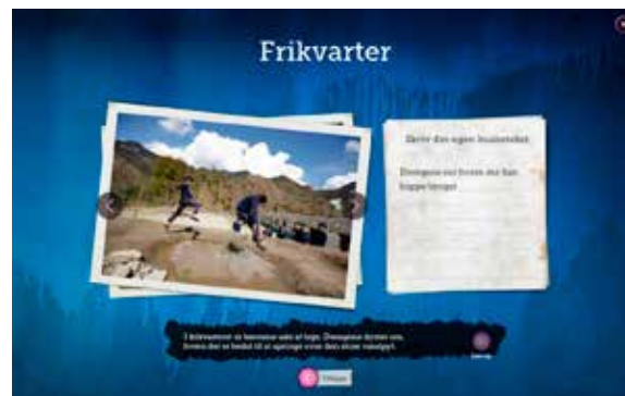
TRIN 3: Når man klikker på et hotspot, åbnes et vindue med en lille fotoserie og en forklarende tekst. Ved siden af kan eleven selv skrive et notat om, hvad hun synes er vigtigt at huske ved lige disse fotos. Når hun til sidst skal lave en fotohistorie, får hun vist et komplet overblik over alle de fotos, hun har set, med sine egne noter ved.