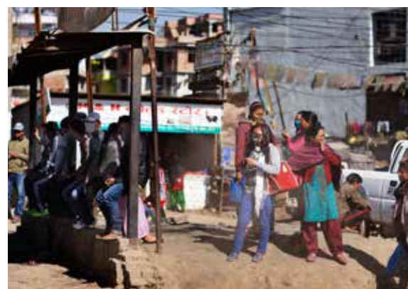
Luftforureningen fra trafik og støv er så massiv i Kathmandu, at mange indbyggere har maske på, når de går ud i byen.