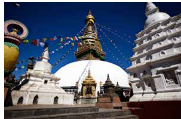
Det buddhistiske Swayambhunath-tempel ligger højt over Kathmandus skyline og kaldes også for Abetempet. Templet blev delvis beskadiget under jordskælvne.