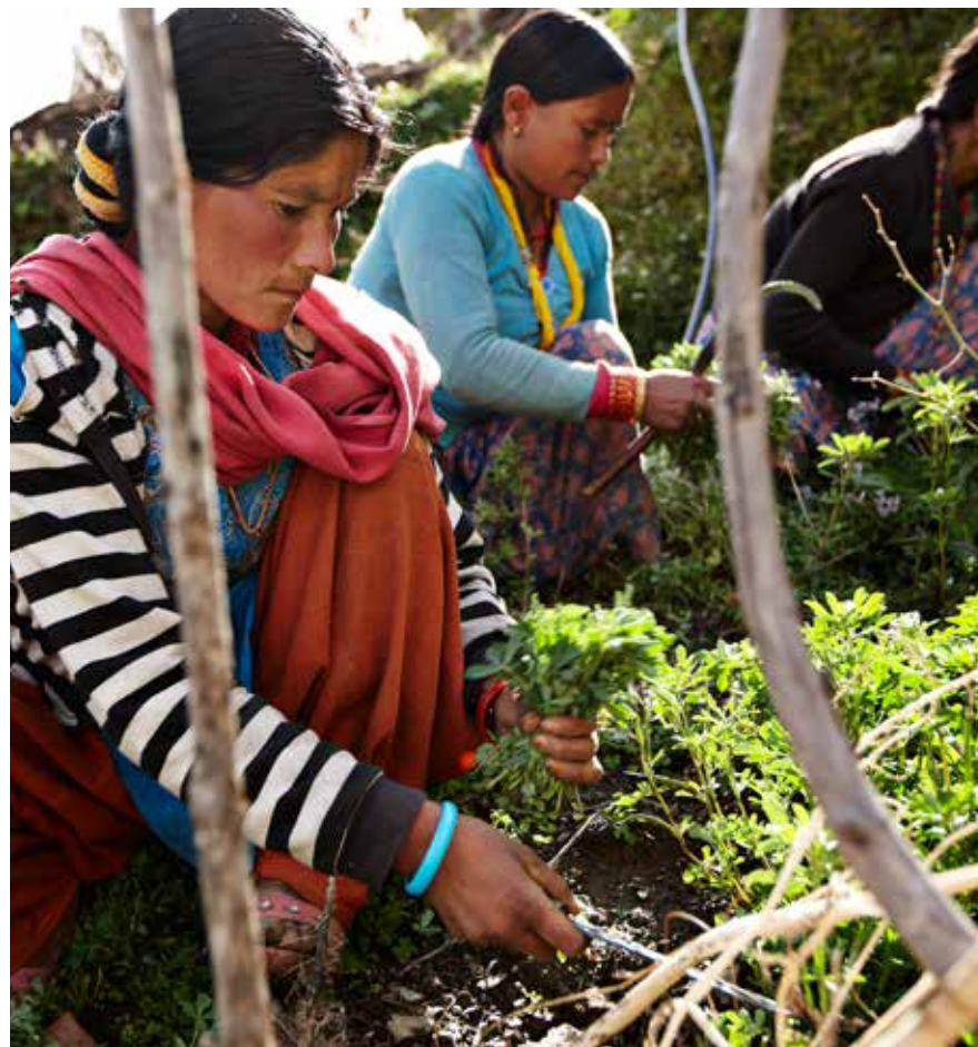
Det er primært kvindernes job at så og høste urter og grøntsager på de talrige, frugtbare terrasser, der er gravet ud i de stejle skråninger rundt om landsbyerne i bjergene.

Herfra må man vandre videre til fods i tre timer, før man omsider er fremme i Jugada, hvor der bor et par tusind mennesker.