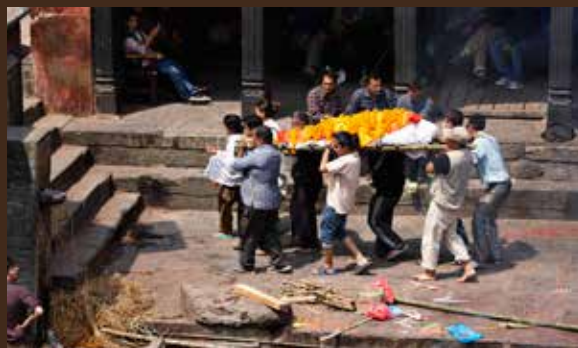
Pashupatinath er et af de helligste templer i Nepal. Det ligger ved Bagmati-floden i Kathmandu. Her kremes mange døde hver dag.