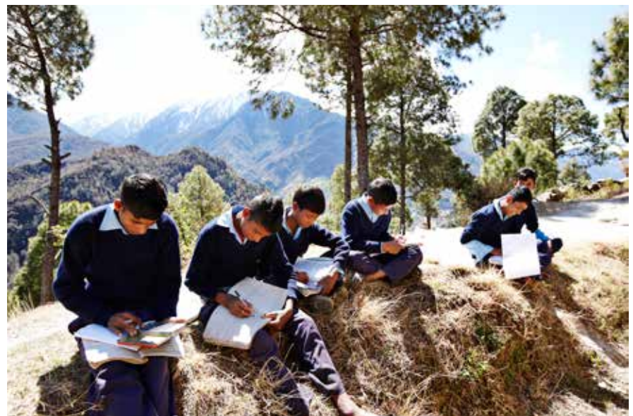
Skolen i Jugada ligger på en bakketop med udsigt til de sneklædte tinder. Frikvarterer bruges på at spille volleyball eller til at lave lektier i. Ofte er det varmere herude i solen, end inde i det uopvarmede skolerum.